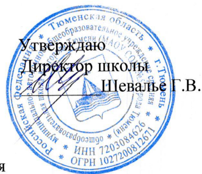
График приема пищи учащимися в МАОУ СОШ № 5 города Тюмени